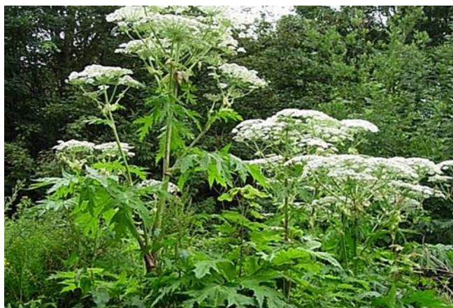
La grande berce du Caucase

Jardiniers, randonneurs, chasseurs, cueilleurs, ... soyez prudents !