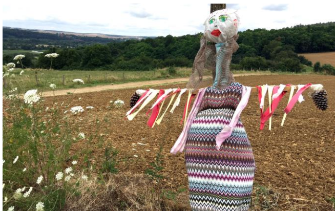
La gagnante du concours 2016 : Miss Epouvanteuse

Le concours d'épouvantails organisé par « La Clé des Champs » en était à sa 3 e édition. Hélas moins de participants cette année, mais la qualité était au rendez-vous. Merci à celles et ceux qui ont participé à ce concours et espérons-les plus nombreux l'année prochaine. Ce concours est là pour animer notre village pendant l'été, profitons-en !