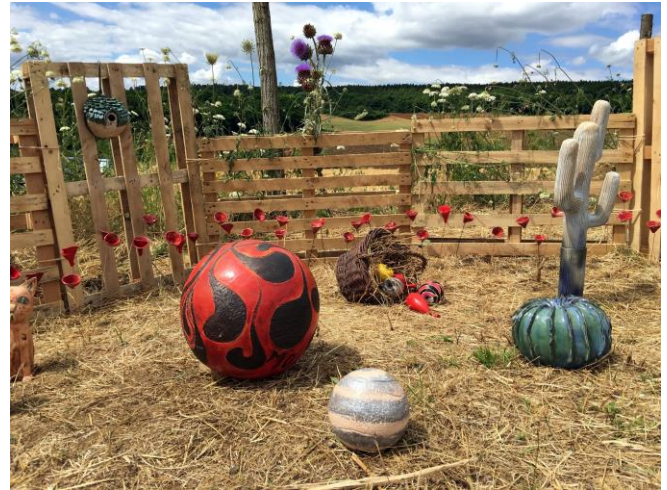
Quelques œuvres de l'atelier céramique d'Animation-Village