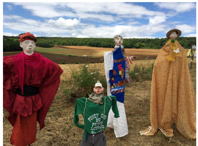
Quelques épouvantails « hors concours »

Une fois la visite terminée, un apéritif offert par la commune a précédé un repas partagé, tiré du sac. L'ambiance était sympathique à l'abri du soleil sous les deux chapiteaux prêtés par Familles Rurales.