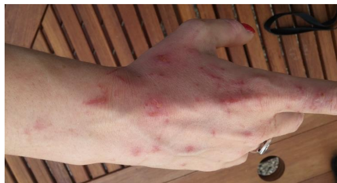
Brûlures provoquées par la plante phototoxique

Sa floraison intervient entre juin et septembre mais cette plante reste dangereuse même à l'état végétatif. Il faut se méfier de ses longues tiges creuses qui, coupées, peuvent projeter des gouttelettes de sève, toxique en contact avec la peau. Elle provoque de graves irritations qui, sous l'effet de la lumière, peuvent se transformer en cloques.