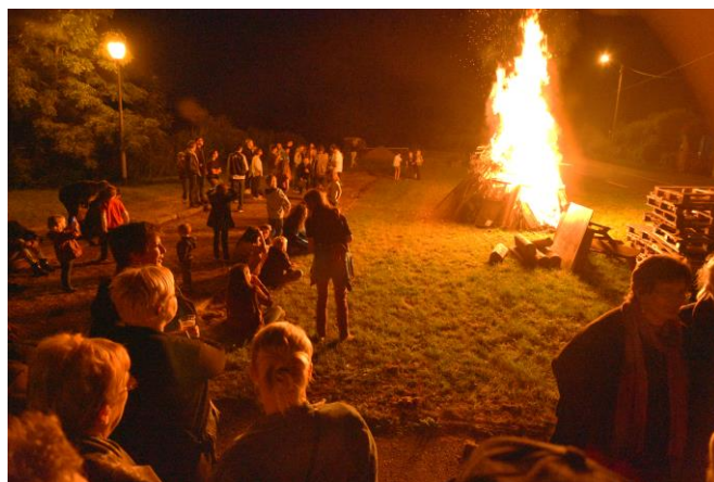
Feu de la Saint Jean – 2 juillet 2016