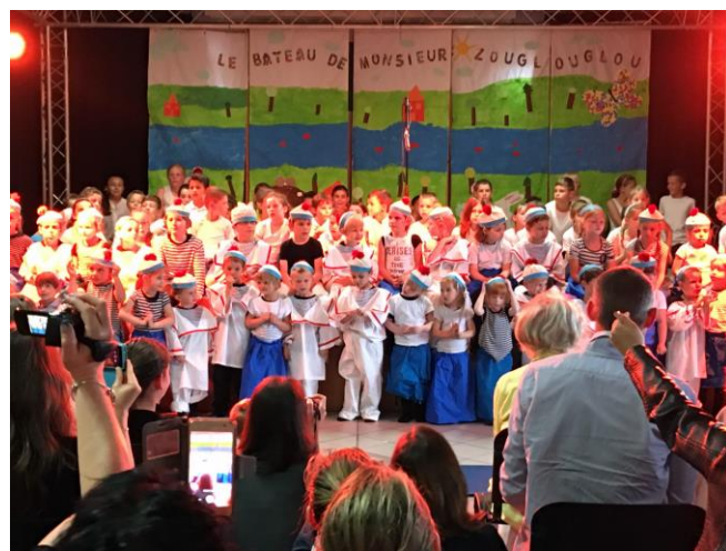
Tous les enfants réunis pour un final éblouissant

Dans le courant du mois de juin et dans le cadre du projet classe d'eau de l'école, les élèves de grande section et de CP sont allés visiter la station d'épuration d'Autreville. Tous les enfants ont écouté attentivement les explications données par le président du SIAMA et petits et grands ont posé de nombreuses questions sur le fonctionnement des bassins plantés de roseaux. Tous ont apprécié ce traitement naturel, très doux pour l'environnement.