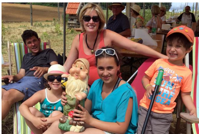
Les gagnants du trophée 2016 avec leur belle « Epouvanteuse »

Le concours d'épouvantails organisé par « La Clé des Champs » en était à sa 3 e édition. Hélas moins de participants cette année, mais la qualité était au rendez-vous. Merci à celles et ceux qui ont participé à ce concours et espérons-les plus nombreux l'année prochaine. Ce concours est là pour animer notre village pendant l'été, profitons-en !