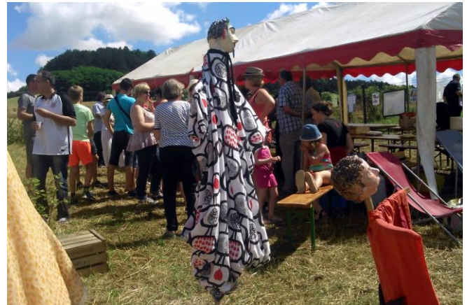
Une cinquantaine de visiteurs à l'heure de l'apéritif

Travail de la terre et verger sont faits pour s'entendre. C'est pourquoi les artistes de l'atelier céramique d'Animation-Village Millery et Autreville ont exposé certaines de leurs œuvres. Chaque visiteur n'a pas manqué d'admirer le talent des potiers de l'association et les œuvres exposées.