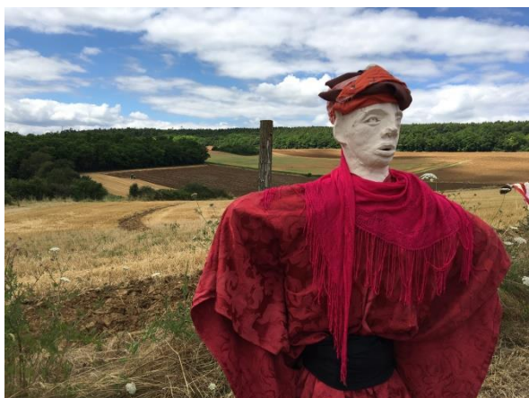
Point de vue depuis le verger pédagogique