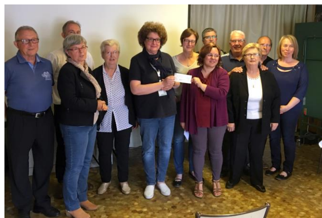
Remise du chèque de 1 000 € à un médecin de l'ICL

Première réussite pour les associations partenaires de ce beau projet : organiser une marche en famille dont les bénéficiaires iront à l'Institut de Cancérologie de Lorraine. La MJC-MPT, Animation-Village, VERSO, la Clé des Champs et les communes se sont donné la main pour organiser cette randonnée autour des deux villages. Plus de 80 participants pour cette première marche « Tous unis contre le cancer » et un bénéfice de 1 000 € remis aux médecins de l'ICL. Préparez-vous pour la prochaine édition l'année prochaine !