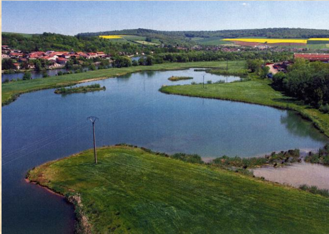
Autreville depuis le plan d'eau EQIOM à Belleville.

Comme prévu dans la convention, la commune recevra dès cette année 52 000 € par an pendant 3 ans et se verra offrir le plan d'eau de Belleville situé en face d'Autreville, de l'autre côté de la Moselle.