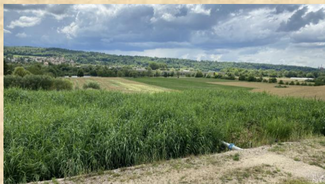
Un des trois bassins de la station d'épuration d'Autreville