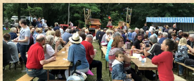
Fête de l'été 2019

La fête des Retrouvailles se tiendra, si tout va bien, le samedi 29 août sur la base de loisirs aux étangs d'Autreville-sur-Moselle.