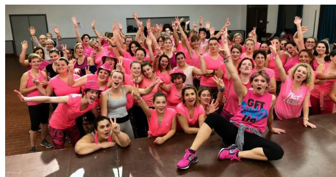
Zumba rose à Loisy

8 associations du territoire du PEL dont 6 associations d'Autreville et Millery (AFR, Clé des Champs, VERSO, Animation Village, Bien vivre à Millery et la MJC) se sont réunies pour proposer trois actions dans le cadre