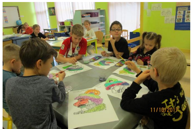
Des élèves de Millery dans l'école d'Autreville

Les élèves des deux classes ont participé à la semaine du goût en travaillant autour de la pomme. Les CP-CE1 ont fait des gâteaux aux pommes et les CE2-CM1-CM2 ont réalisé des tartelettes aux pommes. Tous ces plats ont été dégustés lors d'une matinée spéciale à l'école d'Autreville!