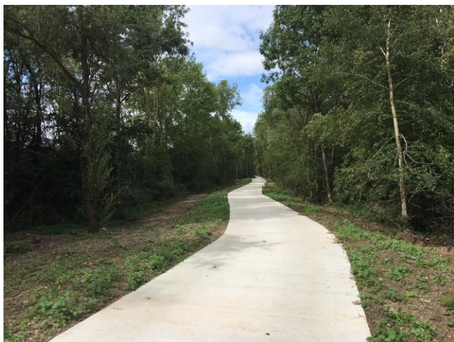
Autreville vers Dieulouard

ou à vélo sans croiser de voiture ou presque (tronçon de la RD40 et petit bout de la D10 pour passer au-dessus de la Moselle). Le véloroute traverse la zone des étangs d'Autreville. Si vous y êtes déjà allés, il est probable que vous ayez croisé les visages connus de promeneurs ou de sportifs, signe que ces chemins ont déjà été adoptés par de nombreux habitants du village. Si vous n'en avez pas encore profité, ces voies sont bien ouvertes à la circulation (non motorisée, sauf sur les espaces partagés avec les pêcheurs autour des étangs). N'hésitez pas à y faire un tour – la marche ou le vélo sont bénéfiques pour la santé !