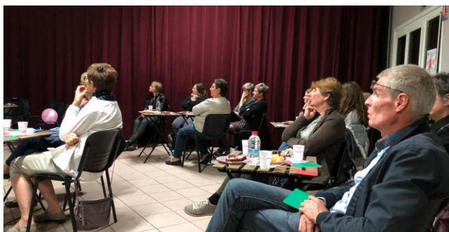
Café-débat alimentation et bien-être à Millery

d'octobre rose, opération mondiale de lutte contre le cancer du sein. 149 personnes ont participé à ces soirées de fête, de solidarité, d'échanges et de sensibilisation zumba rose à Loisy, soirée café-débat alimentation, bien-être et plaisir à Millery et soirée découverte de la sophrologie à Ville au Val.