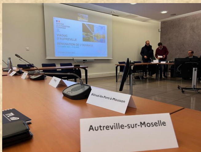
Réunion à la préfecture

Les travaux de réparation du viaduc de l'A31 à Autreville entrent dans leur phase finale et devraient être terminés en 2025. Jusqu'alors, les travaux se sont déroulés sans modification de la circulation sur 2 fois 2 voies. En revanche, les travaux à venir vont nécessiter la fermeture complète de l'autoroute dans les deux sens entre Lesménils et Custines certains week-ends. Les premières fermetures sont programmées dès mars 2024. Des déviations seront mises en place. Lors de certaines fermetures prévues pour 34 h, la circulation Nord-Sud des véhicules légers sera déviée par la RD40 du samedi 20h00 au lundi 6h00.