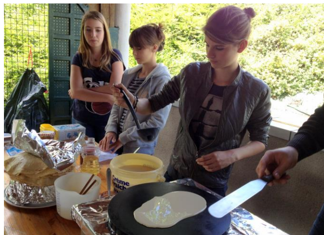
et mettent la main à la pâte pour « P'Art Chemins »