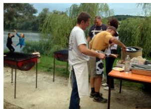
Bénévoles au travail