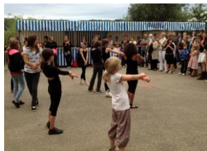
Spectacle de danse