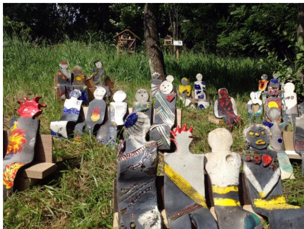
Les œuvres des élèves de l'école de Millery