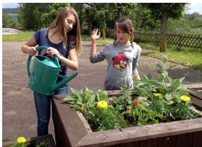
Les jeunes du CMJ fleurissent le village