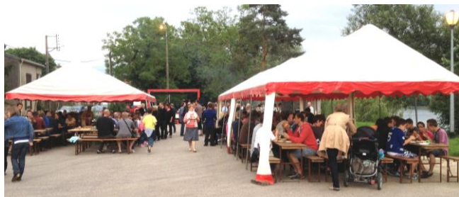
Les habitants des deux villages - plaisir d'être ensemble