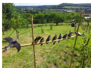
Une jolie pêcheuse et des hirondelles fêtent l'arrivée de l'été