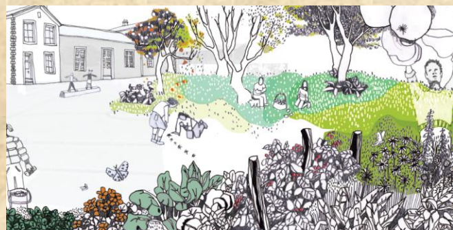
Du vivant dans ma cour

Grâce à des aides de l'Agence de l'Eau Rhin-Meuse allant jusqu'à 70%, une étude va être lancée cette année pour aménager la cour de l'école maternelle ainsi que la transformation de l'atelier communal situé en-dessous en une nouvelle salle communale. Un projet d'ensemble comprenant l'école, la salle polyvalente et le talus de la place du Lavoir sera mis en œuvre durant ce mandat et cela dès cette année.