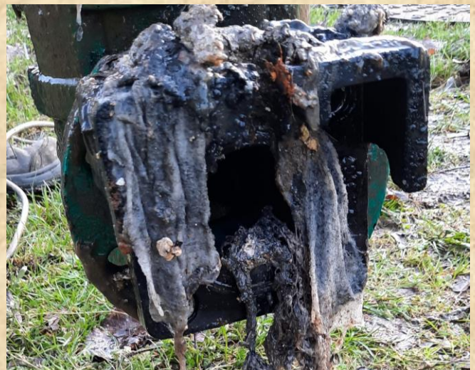
Pompe de relevage bouchée par des lingettes

Ne jetez dans les toilettes que du papier toilette !