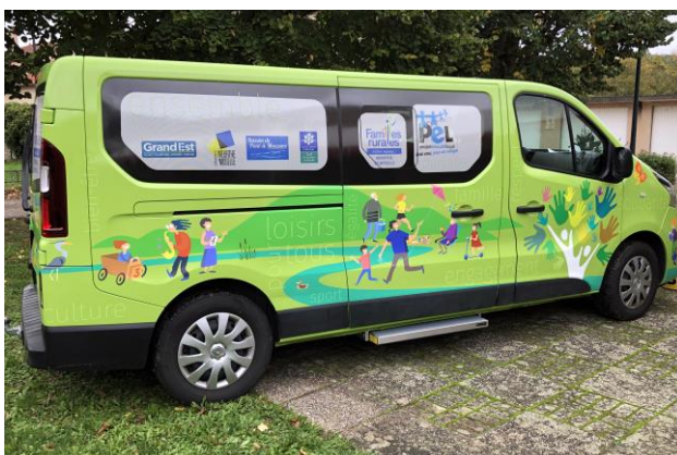
Un minibus coloré au service des associations du PEL