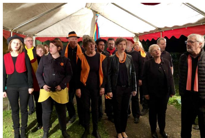
Apéro-concert animé par les Hurléloups