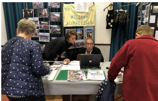
Stand de l'AFR Millery-Autreville

D'autres associations autrevilloises ont exposé leurs actions. Ce fut le cas de l'AFR et ses nombreuses activités ainsi que de VERSO et la solidarité internationale avec le Sénégal.