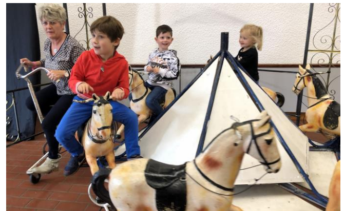
Qui se souvient de l'ancien manège des Magasins Réunis ?

L'exposition de photos retraçant 20 années d'existence du PEL installée, les stands des associations mis en place, l'après-midi de fête pouvait commencer. Tout d'abord, place au théâtre avec la compagnie Roue libre qui a présenté au public son spectacle « Caracordage » fait de poésie et de bouts de ficelle et de cordes diverses.