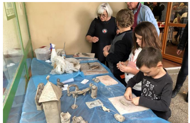
20 ans du PEL – Animation Village anime un atelier poterie