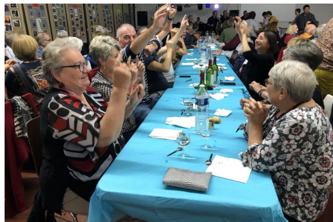
Buffet et soirée dansante pour clore la fête

D'autres associations autrevilloises ont exposé leurs actions. Ce fut le cas de l'AFR et ses nombreuses activités ainsi que de VERSO et la solidarité internationale avec le Sénégal.