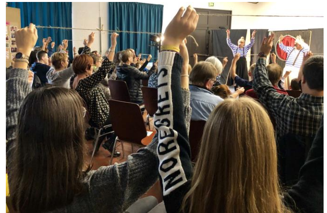
Spectacle tout public l'après-midi

Voici un retour en images sur la fête des 20 ans de notre Projet Educatif Local au service de tous les habitants des 14 communes, des associations et des écoles de ce territoire. L'anniversaire a été fêté le samedi 19 octobre.