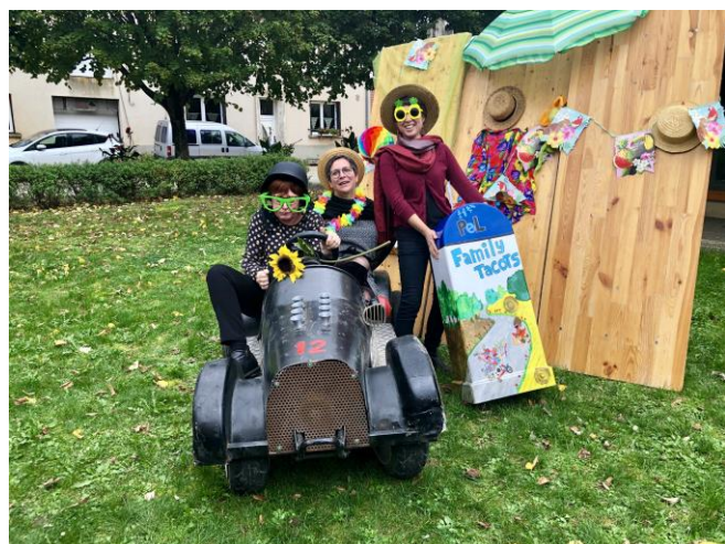
Un PEL dans la course !

De nombreux visiteurs et bénévoles ont participé au « tacotmaton », se faisant ainsi photographier sur un des bolides ayant participé au dernier « Family Tacots » de Loisy. Ici, de dignes représentantes de la fédération Familles Rurales en compagnie de la présidente du PEL.