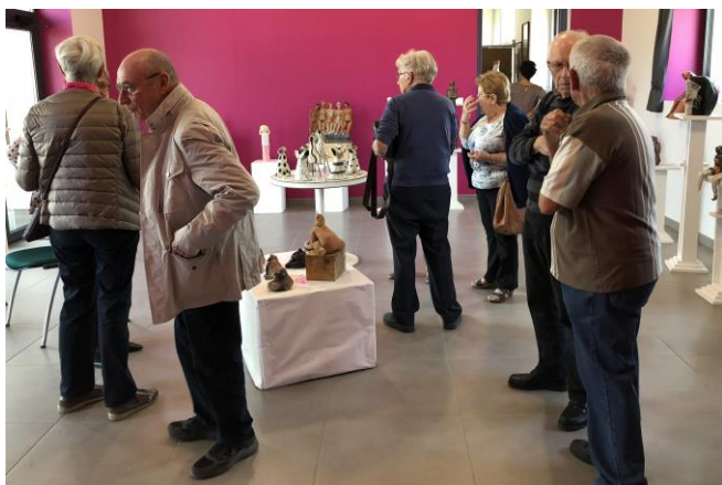
L'atelier poterie expose à Sainte Geneviève

Les associations et le PEL se mobilisent fortement pour la recherche contre le cancer. Après la marche « Tous unis contre le cancer » qui s'est déroulée en septembre, c'est pour « Octobre Rose » que les bénévoles se retroussent les manches. Pas moins de sept manifestations à l'ordre du jour ! Les associations de notre village ont particulièrement porté l'exposition d'artistes de Sainte Geneviève (céramiques, peintures, sculptures), la Zumba Rose qui s'est tenue à Loisy, l'atelier Fleurs de Bach le 22 octobre à Autreville et le défilé de mode suivi d'un concert à Bezaumont. Des images de ce défilé et des créations d'un couturier résidant à Autreville seront publiées dans le prochain bulletin.