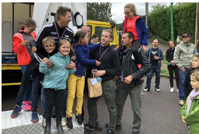
L'équipe des vainqueurs – Lesménils

« Mojo Chillin », groupe rock "made in Autreville" dont on attendait le concert, n'a pas pu jouer, à notre grand regret, car la pluie a mouillé les instruments. Ce n'est que partie remise!