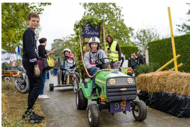
Au départ de la course Family Tacots