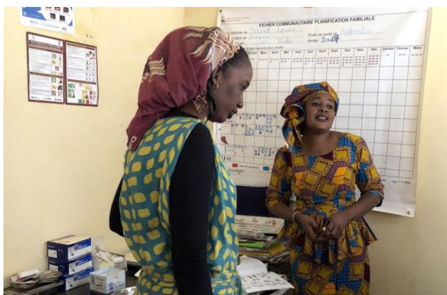
Case de santé renouvelée et personnel formé

La construction d'une nouvelle bibliothèque et la réparation du toit de la maison des enseignants, la correspondance scolaire, le suivi des cases de santé renouvelées et équipées par l'association seront également au programme de même que la poursuite de l'accompagnement de l'espace petite enfance créé en 2012. Davantage d'informations sur le site https://verso-blogsite.org/