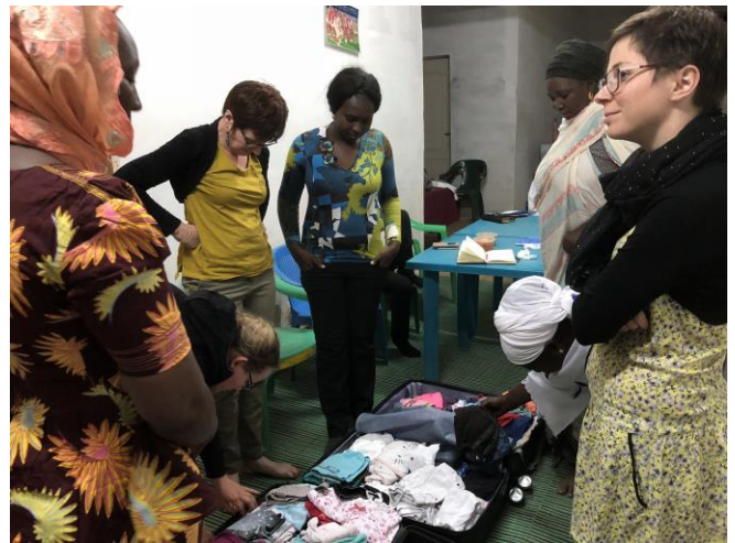
Linge remis à un groupement féminin au profit de la petite enfance

A chaque voyage, les membres emportent dans leurs bagages des habits pour les enfants, du matériel médical, du linge de maison ou encore des jeux pédagogiques pour l'école maternelle.