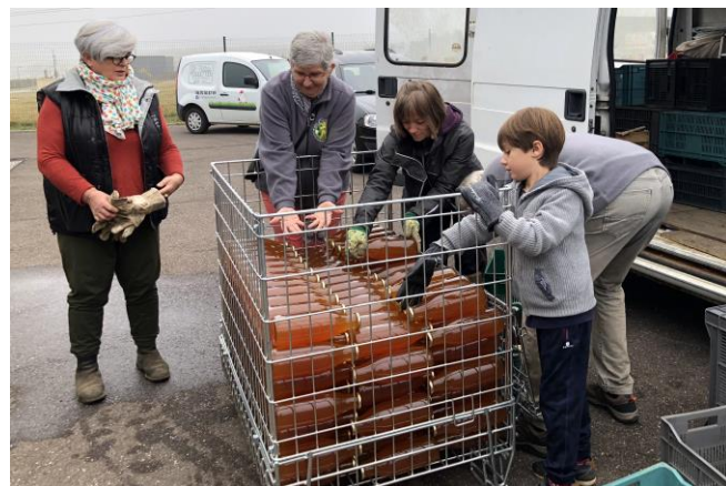
Le jus de pomme encore chaud tout juste sorti du pressoir

Cette année une belle petite équipe a glané près de 400 kg de pommes pour la fabrication d'un jus de qualité au pressoir de Saizerais le mercredi 10 octobre. Le groupe qui a suivi les travaux de pressage de A à Z vous assure que ce sont bien les pommes de la Clé des Champs qui sont dans les bouteilles « pur jus naturel ». Elles seront vendues prochainement au prix de 2,50 € le litre. Avis aux amateurs