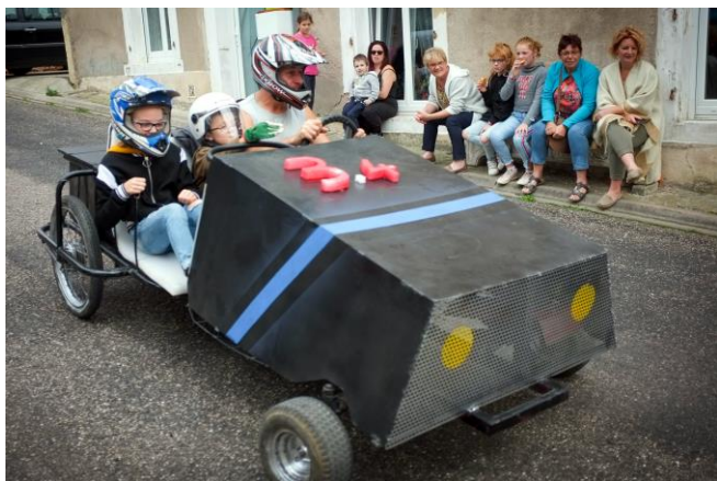
Les essais en famille le samedi

Pour sa 2 e édition, Family Tacots s'est déroulée dans notre village le 23 septembre. Une année de préparation sous la bienveillance du PEL avec des pilotes motivés, des associations bien présentes et des élus impliqués pour un week-end réussi. Comment ? Il a plu ce dimanche-là ? Ah oui c'est vrai mais c'était bien quand même.