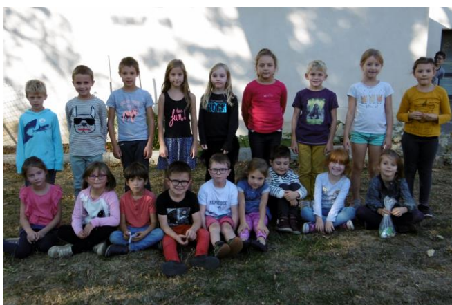
La classe de CP – CE1

Les élèves de l'école de Millery ont fait une belle rentrée le lundi 3 septembre, en musique! Les élèves ont dans un premier temps créé un paysage sonore à partir d'une feuille de papier puis tous ont appris une chanson de circonstance : Sacré Charlemagne!