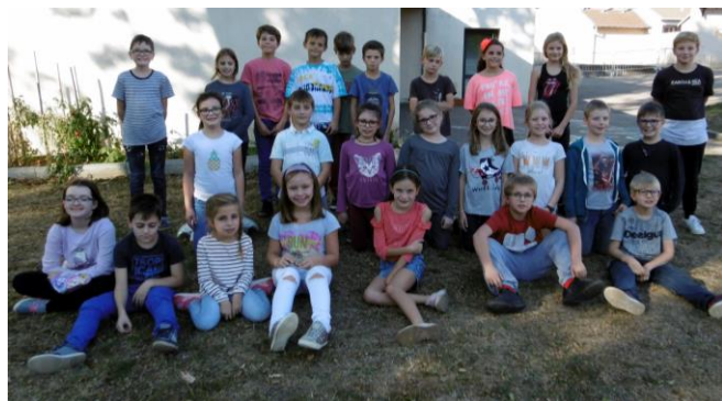
La classe de CE2 – CM1 et CM2

Les élèves de l'école de Millery ont fait une belle rentrée le lundi 3 septembre, en musique! Les élèves ont dans un premier temps créé un paysage sonore à partir d'une feuille de papier puis tous ont appris une chanson de circonstance : Sacré Charlemagne!