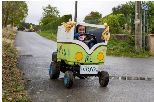
Première descente du tacot PEL de Loisy

Mais bon, toutes les mesures de sécurité avaient été prises alors, en avant! Déjà de très bons moments passés durant cette journée.