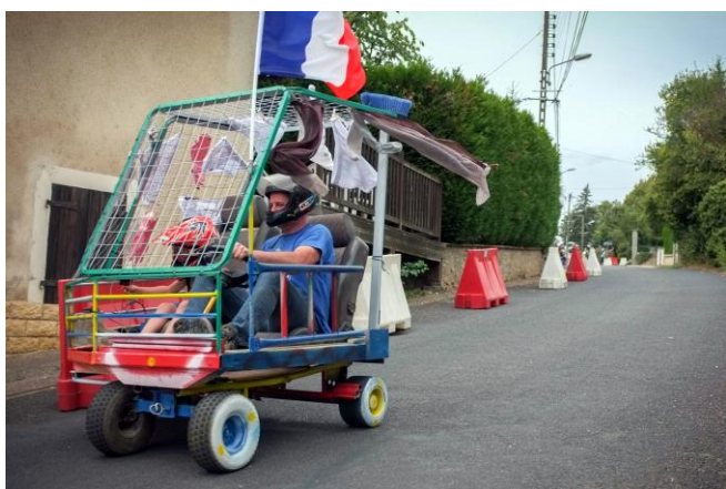
La lessive va bien sécher

Trois descentes adultes et trois descentes jeunes étaient prévues mais la pluie battante a contraint les organisateurs à arrêter les descentes alors qu'il restait encore une course pour chaque groupe.