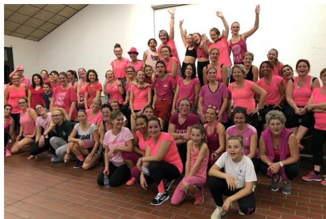
Zumba Rose à Loisy pour Octobre Rose