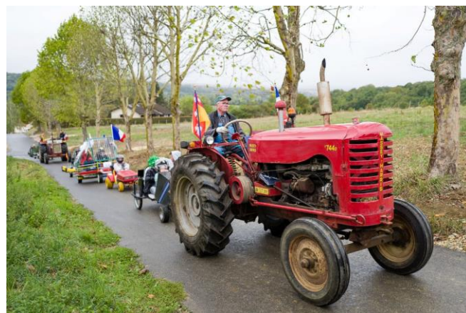
La remontée par les tracteurs de Sainte Geneviève

Le dimanche, les premiers tacots se sont élancés sous un crachin qui rendait la route glissante, ce qui ajoutait encore au spectacle. Entre deux courses, les beaux tracteurs anciens du musée agricole de Sainte Geneviève étaient au rendez-vous pour remonter les véhicules, les pilotes, les enfants et ceux qui voulaient voir la ligne de départ sans trop se fatiguer.