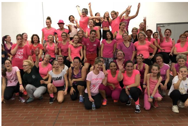
De nombreuses Autrevilloises pour la Zumba Rose à Loisy

Les associations et le PEL se mobilisent fortement pour la recherche contre le cancer. Après la marche « Tous unis contre le cancer » qui s'est déroulée en septembre, c'est pour « Octobre Rose » que les bénévoles se retroussent les manches. Pas moins de sept manifestations à l'ordre du jour ! Les associations de notre village ont particulièrement porté l'exposition d'artistes de Sainte Geneviève (céramiques, peintures, sculptures), la Zumba Rose qui s'est tenue à Loisy, l'atelier Fleurs de Bach le 22 octobre à Autreville et le défilé de mode suivi d'un concert à Bezaumont. Des images de ce défilé et des créations d'un couturier résidant à Autreville seront publiées dans le prochain bulletin.