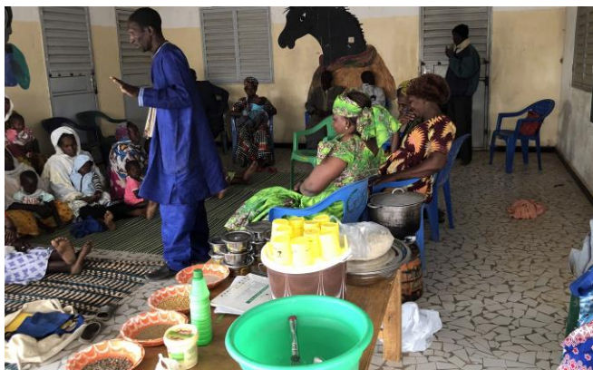
Conférence sur la préparation de bouillies nutritive

Au programme des voyageurs, la poursuite des actions engagées depuis maintenant 10 ans : dépistage et prévention de la malnutrition des enfants, équipement et suivi de l'Espace Adolescents qui informe les jeunes sur la contraception, les MST, l'évitement des grossesses précoces.