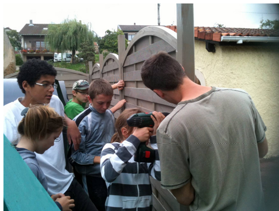
Les jeunes habitants d'Autreville et Millery travaillent pour notre village