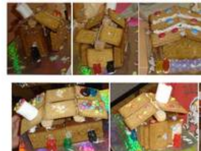
Maisons en pain d'épices

L'équipe et les enfants de « Bricoles et Galipettes », vous souhaitent de bonnes fêtes.