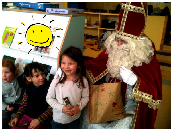
Visite de Saint Nicolas à l'école