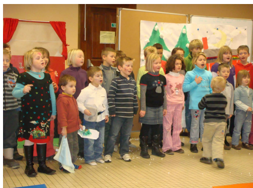
Spectacle de Noël à l'accueil périscolaire