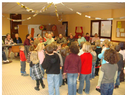
Les élèves de l'école chantent pour les grands