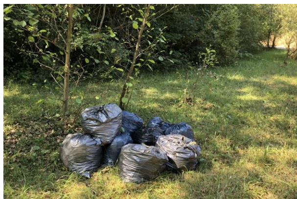
Un autre aspect de notre site naturel