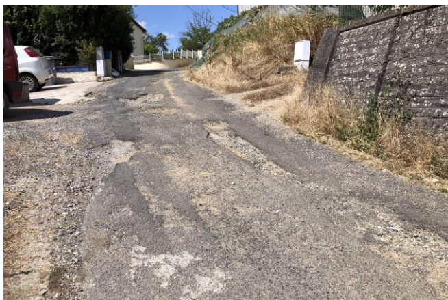
Partie à refaire rue du Planté

Les travaux destinés à créer une rampe d'accès à la mairie pour les personnes handicapées, ou simplement âgées, débuteront la semaine prochaine, le mercredi 11 juillet, et dureront jusqu'à la fin du mois. L'accès au secrétariat de la mairie se fera par la cour, en utilisant le sentier à droite de la mairie. Les travaux seront réalisés par l'entreprise STPL de Dieulouard. La circulation devant la mairie sera interdite pendant les travaux.