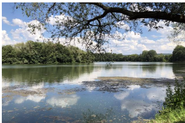
Une image de nos étangs