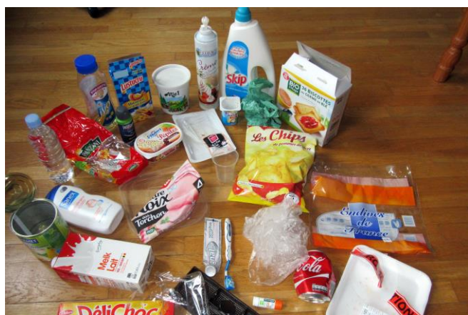
Tout ne va pas dans les sacs jaunes !!!

Tri des déchets : 16 sur 20 en 2012, juste au-dessus de la moyenne en 2015 ! Que se passe-t-il à Autreville? Pourquoi avons-nous baissé notre note en "tri des déchets" ? Replongeons-nous dans nos cours pour faire mieux la prochaine fois. Voilà ce qu'il convient de faire pour bien trier :