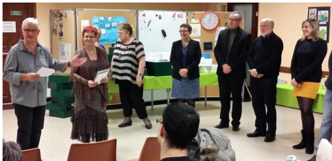
Discours prononcé lors de la cérémonie des vœux