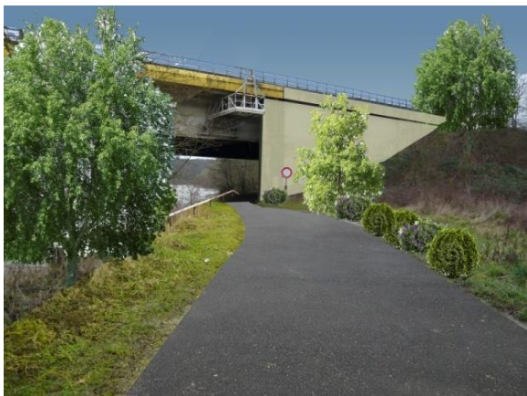
Le Vélo Route passera sous le viaduc le long de la Moselle

avant de rejoindre nos étangs que les cyclistes pourront admirer avant de rejoindre Dieulouard.