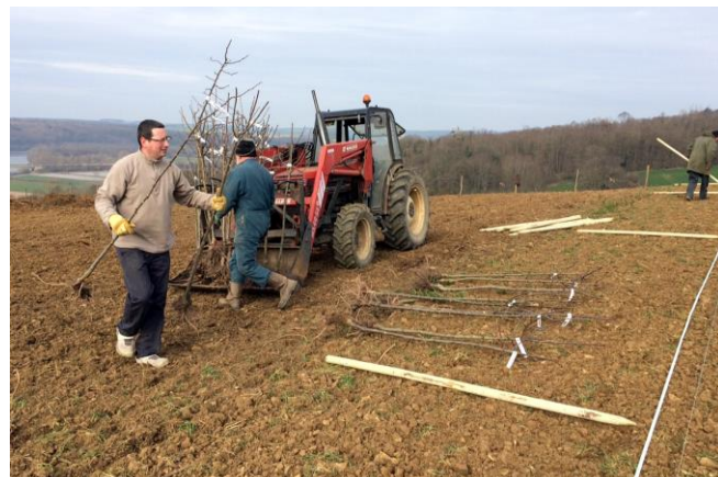
Plantation au printemps 2015

d'ailleurs : un peu de ramassage de pierres pour préparer le terrain à un semis d'herbe, une petite clôture à poser pour limiter les incursions de chevreuils « brouteurs de greffons ». Plus nous serons nombreux et équipés, plus les résultats du chantier seront visibles et plus se sera sympathique de partager une petite collation avant et ... après.