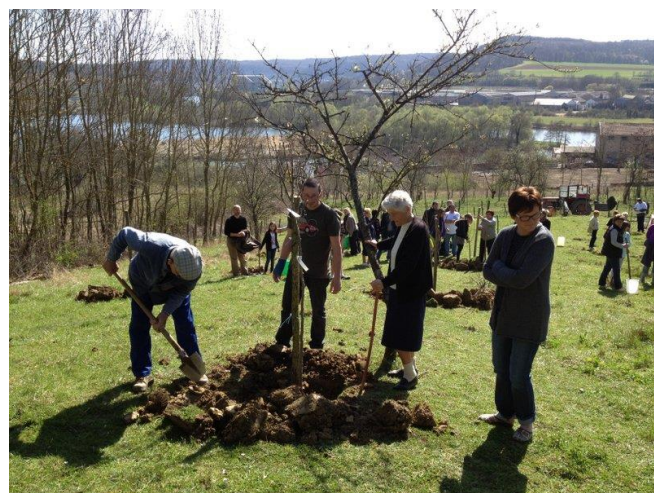
Plantation au printemps 2012