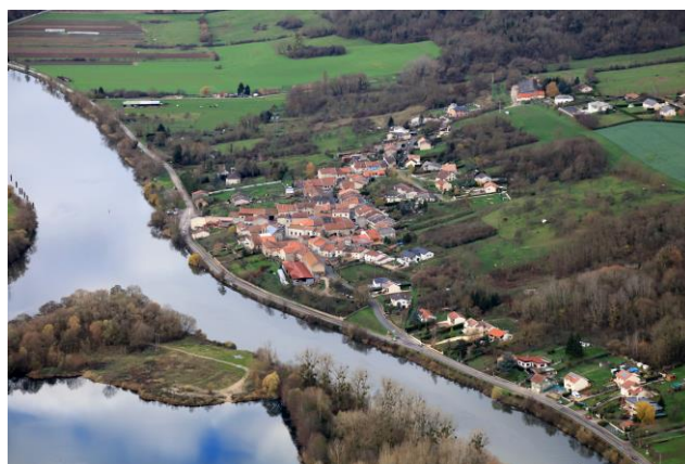
Un village inséré dans la nature