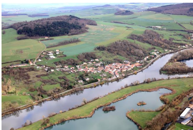
Autreville sur Moselle vue du ciel