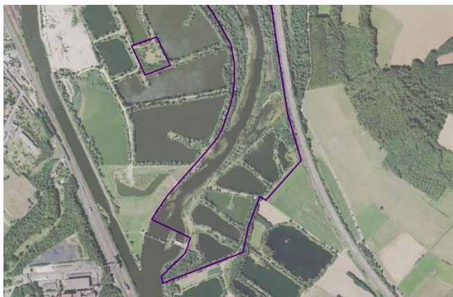
La zone ENS d'Autreville

L'ENS du Val de Moselle dont font partie 6 étangs d'Autreville correspond à un complexe de 130 hectares composé de milieux alluviaux variés. Ce classement effectué par le Conseil Départemental n'a pas de portée réglementaire. Une éventuelle démarche de préservation et de valorisation repose sur la volonté des acteurs locaux.