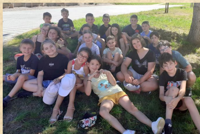
Classe de CE2-CM1-CM2