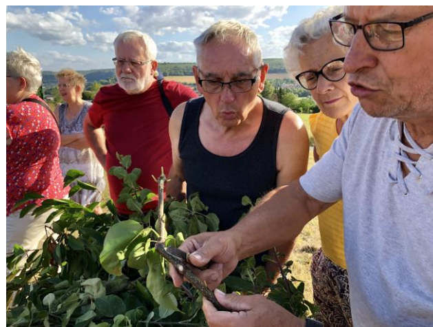
Séance de greffe au verger pédagogique