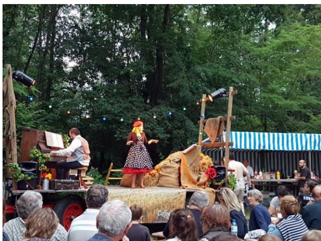
Concert lors de la fête de l'été sur la base de loisirs