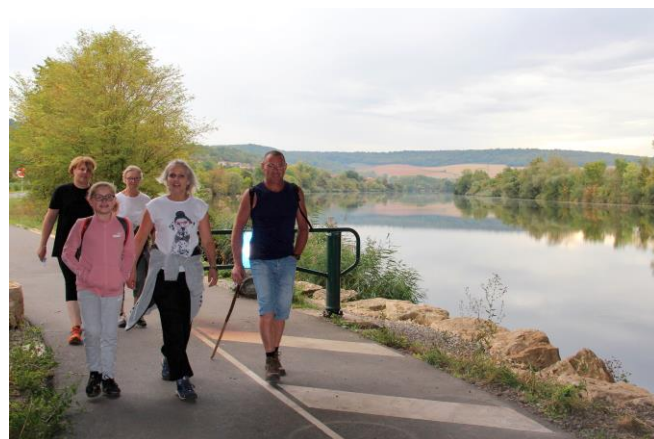
Des marcheurs d'Autreville et Millery

Le dimanche 22 Octobre, la marche « TOUS UNIS CONTRE LE CANCER » était organisée à Autreville-sur-Moselle. A l'initiative de la Maison pour Tous de Millery et avec la participation de quatre associations d'Autreville et de la commune, trois parcours ont été balisés sur les sentiers et chemins de notre village. La véloroute voie verte a également accueilli les quatre-vingt marcheurs pour des parcours de 7km, 11 km et 15 km pour les plus aguerris. Les bénévoles sont revenus enchantés de leur participation à cette marche : organisation et balisages parfaits, paysages magnifiques, marche agréable, temps superbe puis apéritif à base de jus de pommes offert par la mairie d'Autreville-sur-Moselle. Les fonds récoltés seront versés à l'Institut de Cancérologie de Lorraine par l'intermédiaire du Professeur Jean Louis MERLIN, Directeur de la recherche. Un grand merci à vous tous, donateurs, marcheurs et bénévoles. Rendez-vous l'année prochaine !