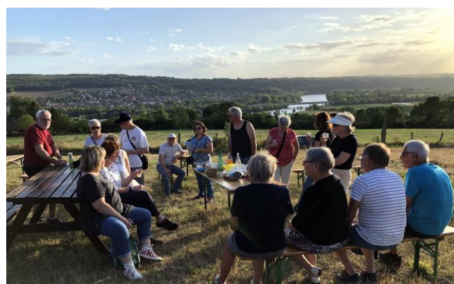
En attendant les étoiles depuis le verger pédagogique

Le dimanche 22 Octobre, la marche « TOUS UNIS CONTRE LE CANCER » était organisée à Autreville-sur-Moselle. A l'initiative de la Maison pour Tous de Millery et avec la participation de quatre associations d'Autreville et de la commune, trois parcours ont été balisés sur les sentiers et chemins de notre village. La véloroute voie verte a également accueilli les quatre-vingt marcheurs pour des parcours de 7km, 11 km et 15 km pour les plus aguerris. Les bénévoles sont revenus enchantés de leur participation à cette marche : organisation et balisages parfaits, paysages magnifiques, marche agréable, temps superbe puis apéritif à base de jus de pommes offert par la mairie d'Autreville-sur-Moselle. Les fonds récoltés seront versés à l'Institut de Cancérologie de Lorraine par l'intermédiaire du Professeur Jean Louis MERLIN, Directeur de la recherche. Un grand merci à vous tous, donateurs, marcheurs et bénévoles. Rendez-vous l'année prochaine !